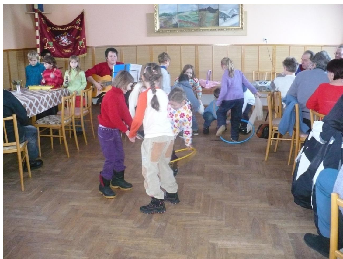
Předvánoční vystoupení žáků na Brdě