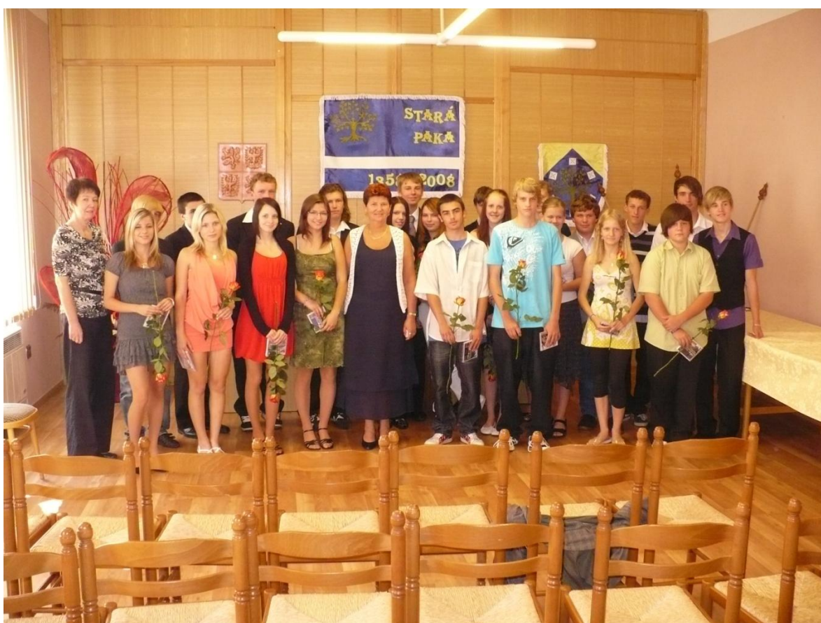
Slavnostní vyřazení žáků IX. třídy