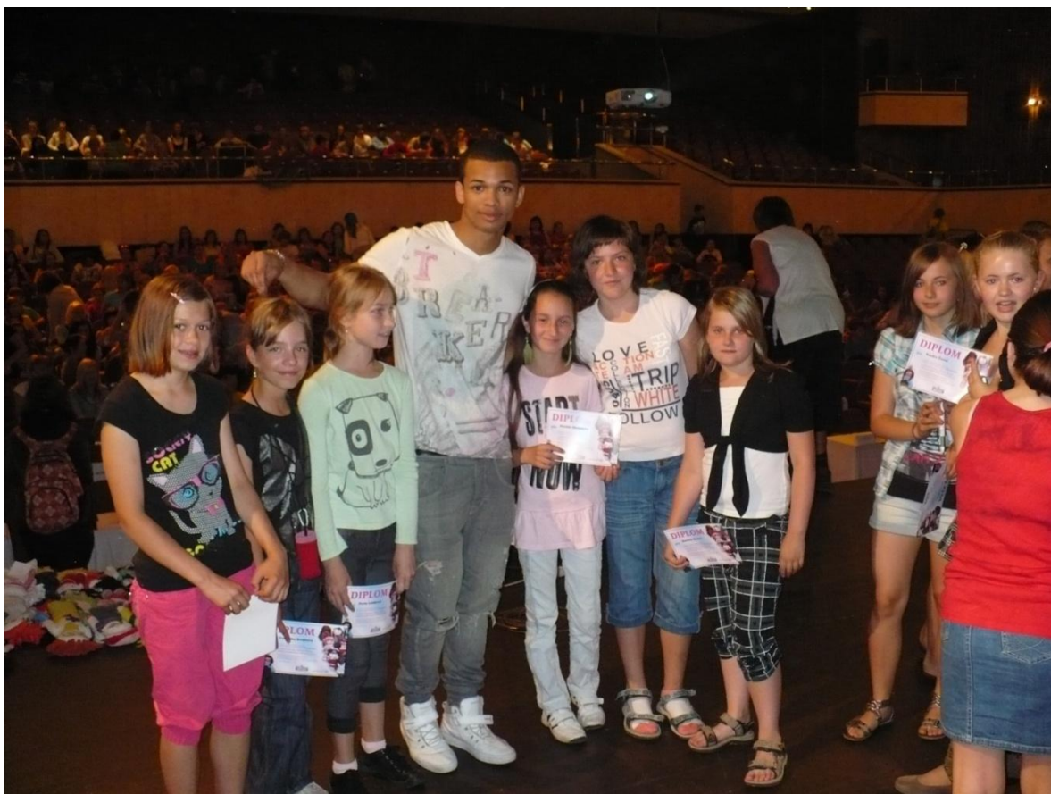
Účastníci soutěže Miss Panenka