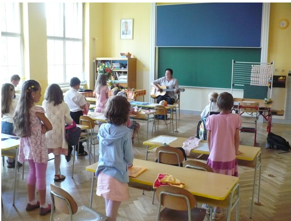
Slavnostní zakončení školního roku 2010 -2011