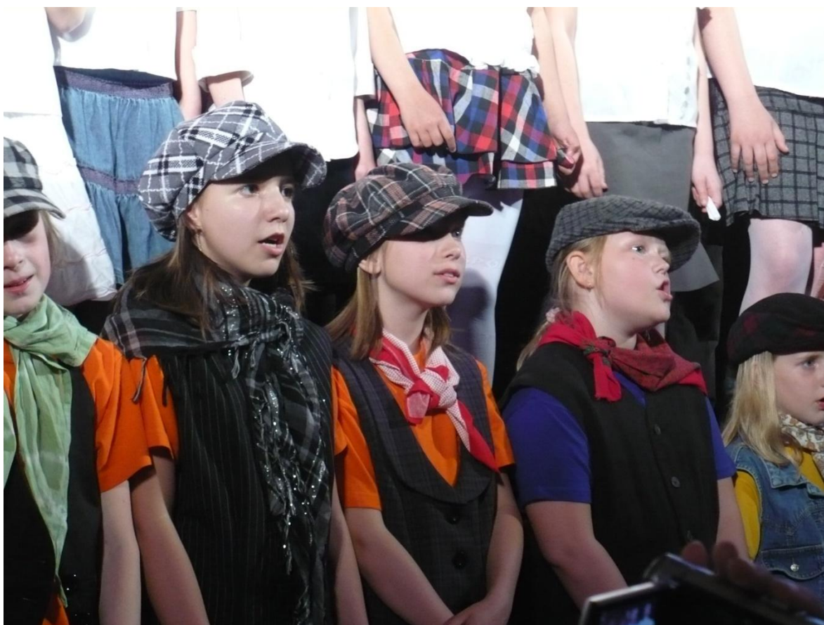
Jarní přehlídka pěveckých sborů v Nové Pace