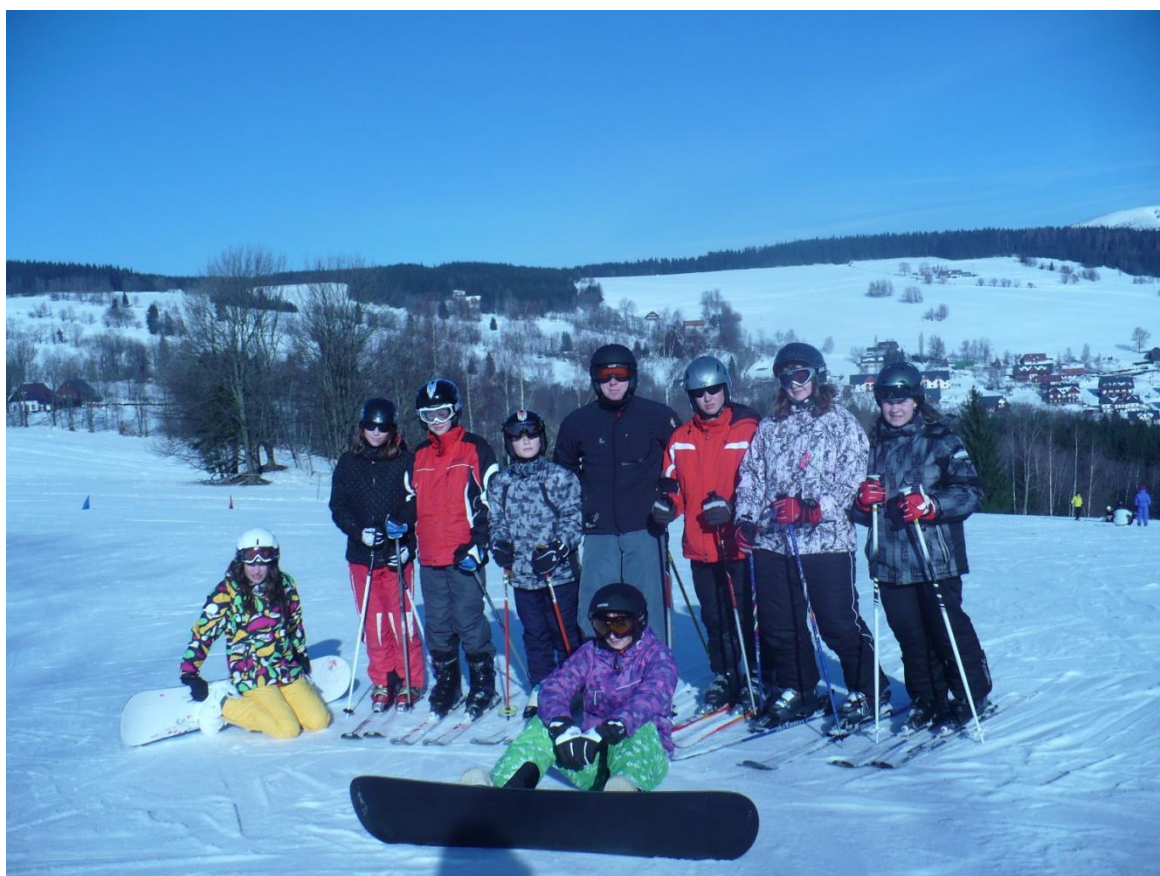
Lyžařský výcvik žáků VII. – IX. třídy