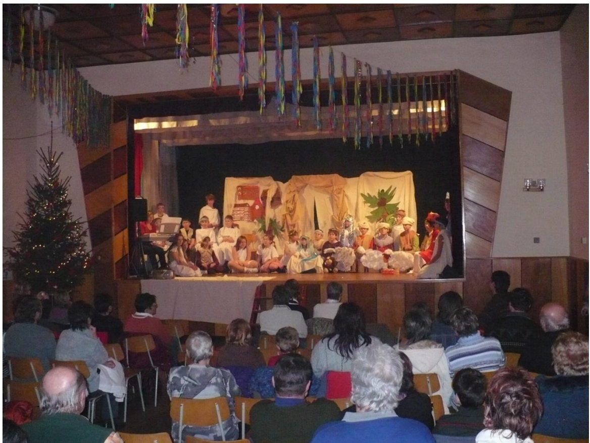
Předvánoční vystoupení žáků v Levínské Olešnici