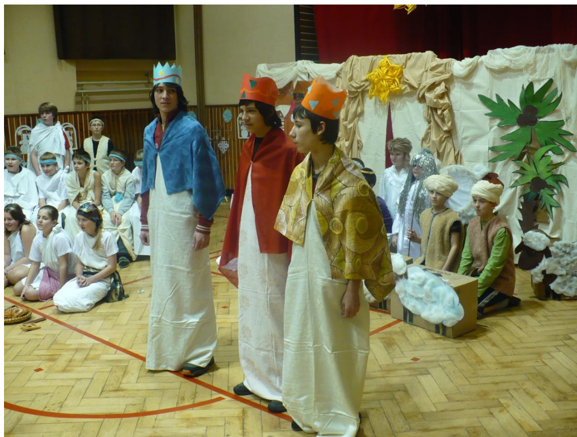
Předvánoční vystoupení žáků v tělocvičně školy