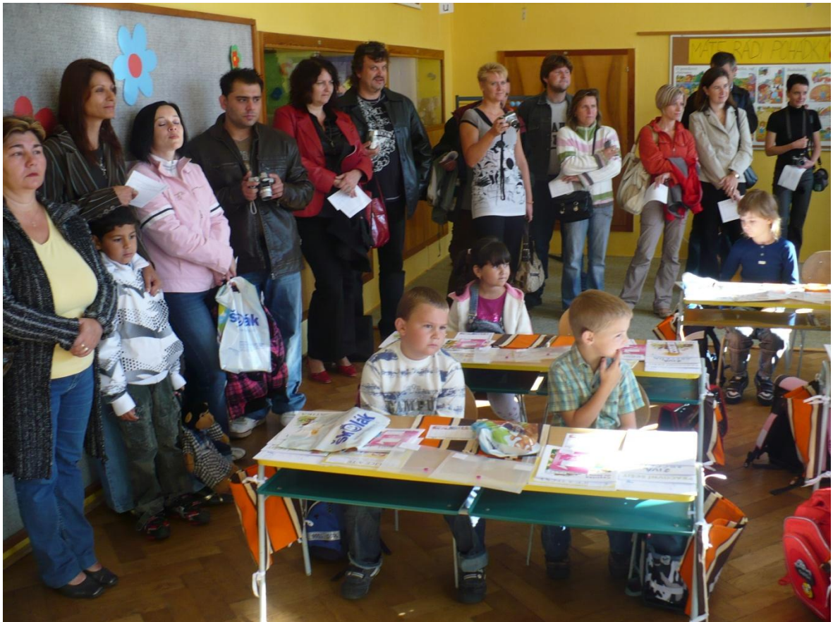
Slavnostní zahájení školního roku 2010 – 2011