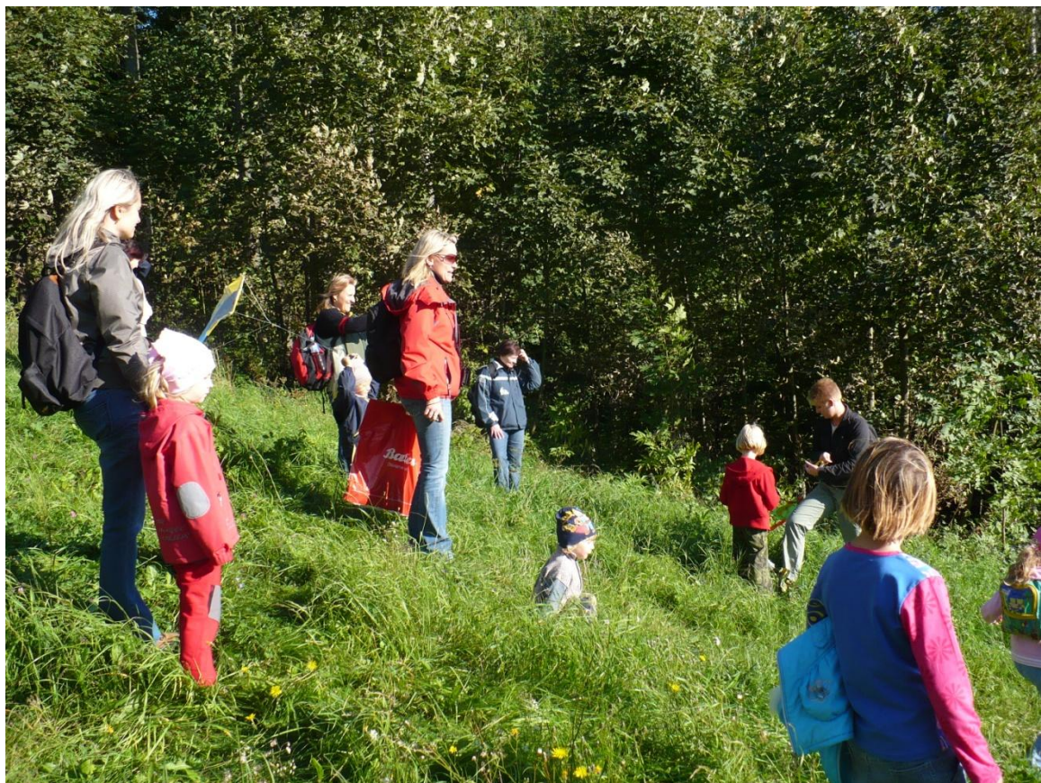
Společný výlet s dětmi, učiteli a rodiči