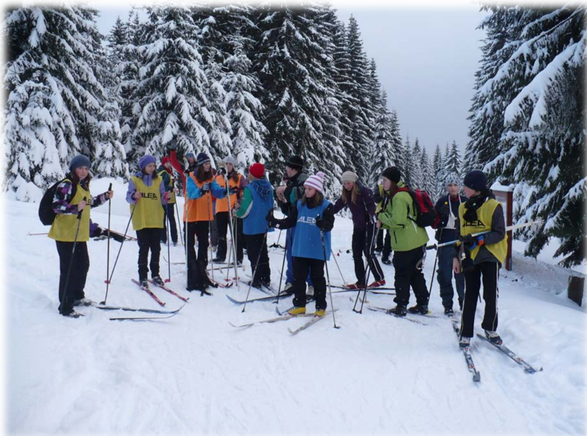
Na výletě na běžkách v okolí „Protržené přehrady“ v Jizerských horách