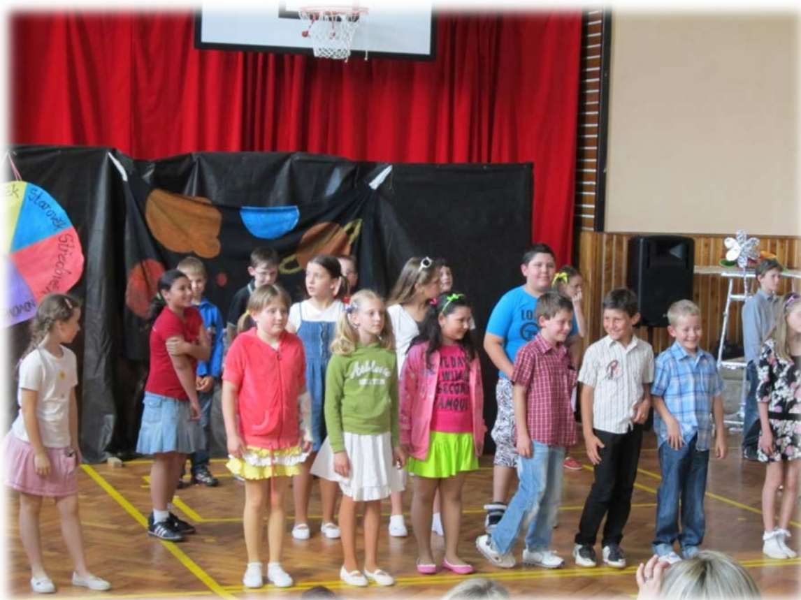
Jarní vystoupení pro veřejnost a rodiče v tělocvičně školy