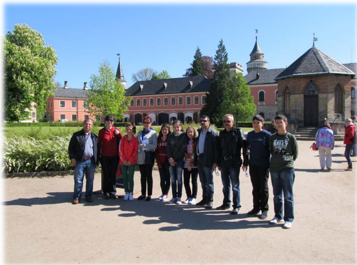
COMENIUS – turecká skupina na zámku Sychrov