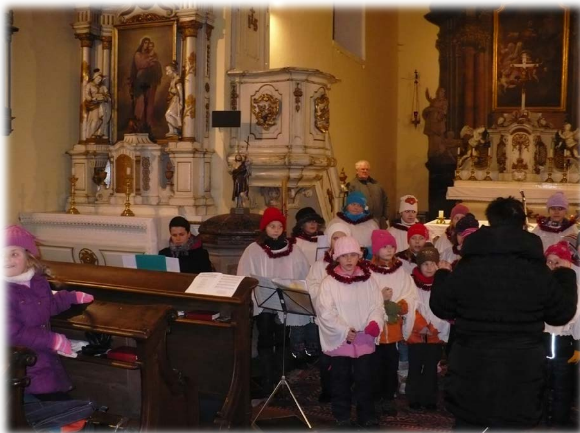
Vánoční vystoupení pěveckého sboru v kostele Sv. Vavřince ve Staré Pace