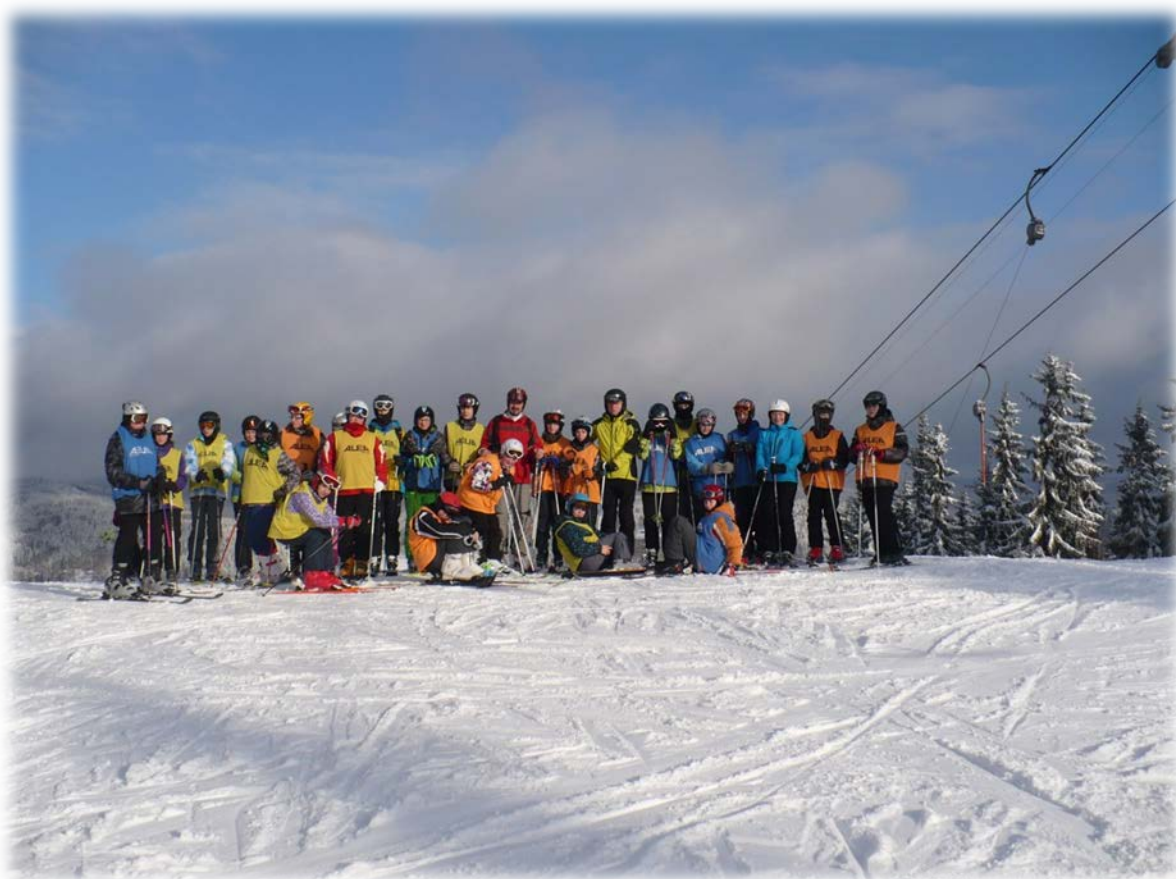
Lyžařský kurz v Albrechticích v Jizerských horách – Tanvaldský Špičák