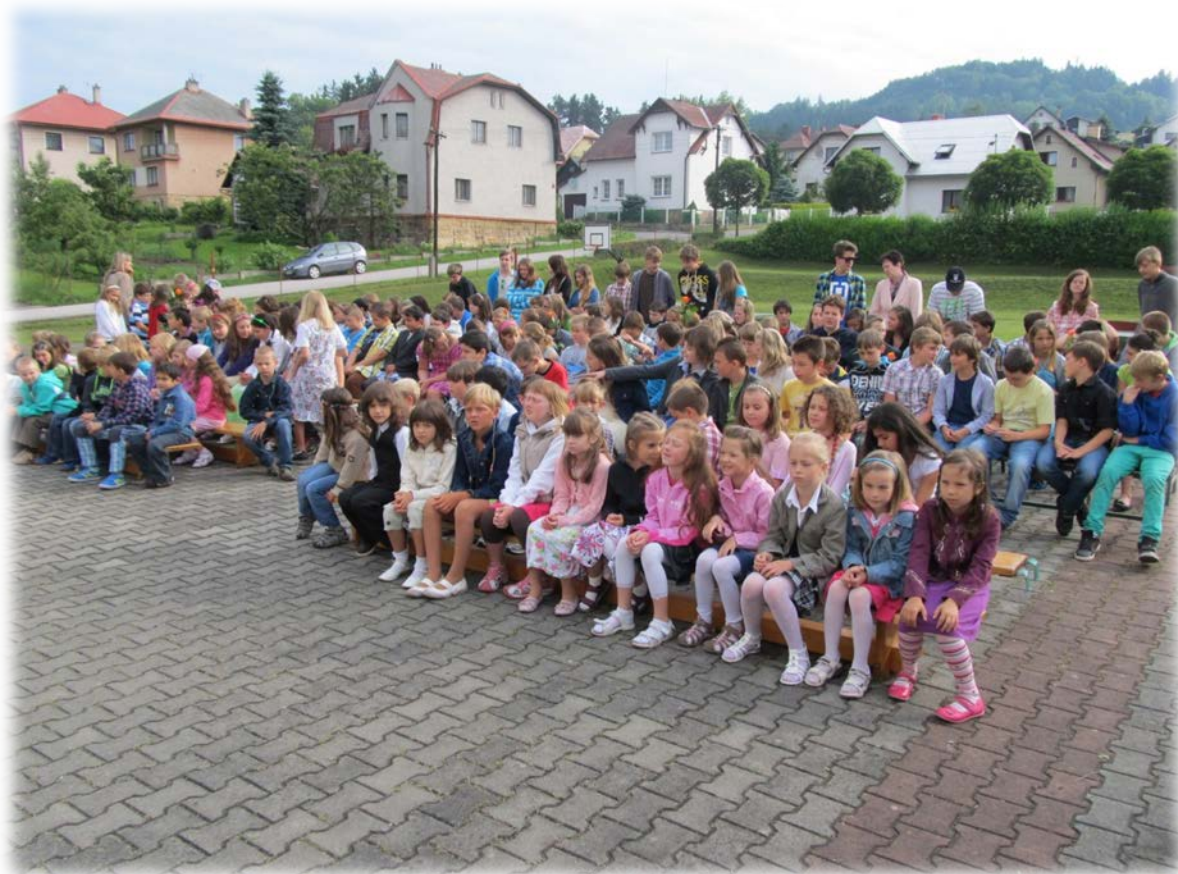
Závěr školního roku 2012 – 2013 na terase školy