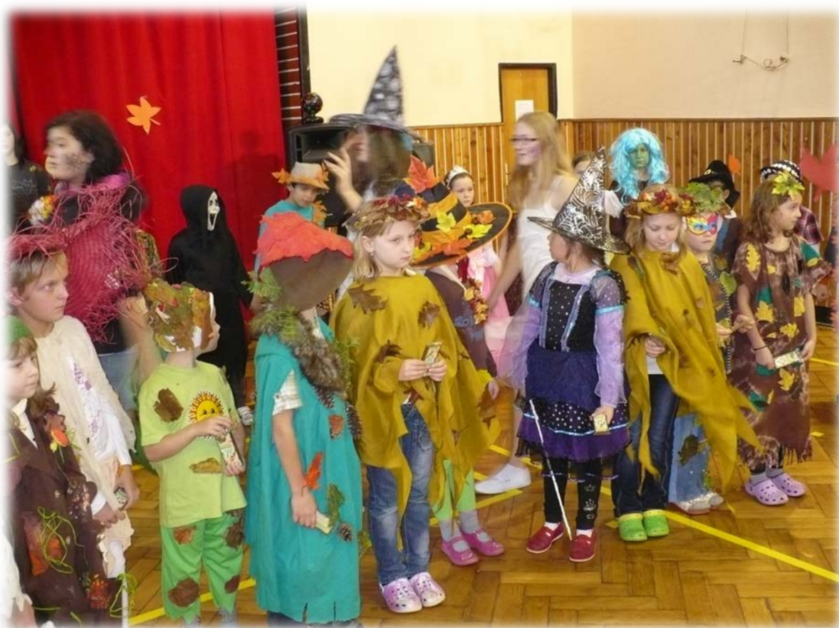
Tradiční rej skřítků – školní karneval