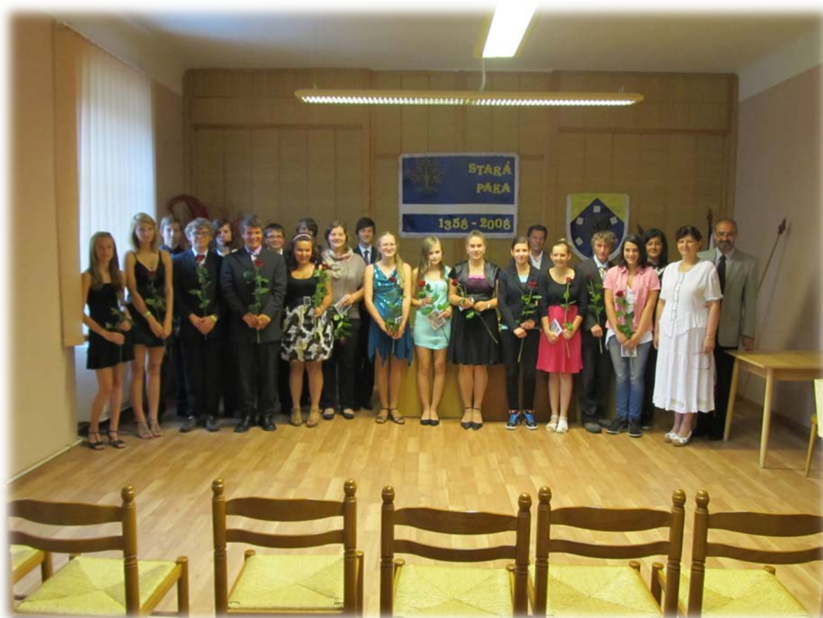
Slavnostní vyřazení žáků 9. ročníku na Obecním úřadu ve Staré Pace