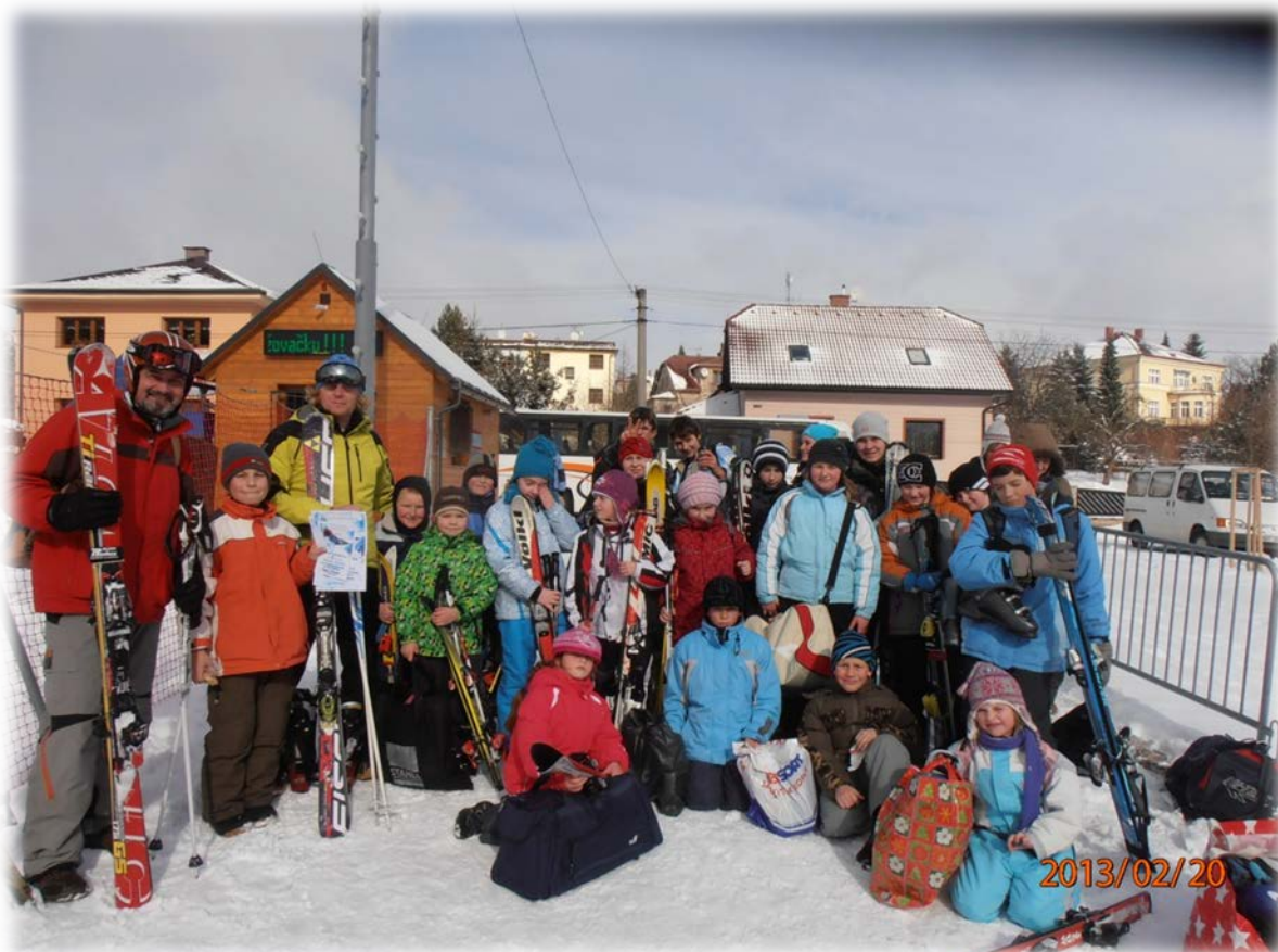
Výprava školy na lyžařských závodech na „Máchovce“ v Nové Pace