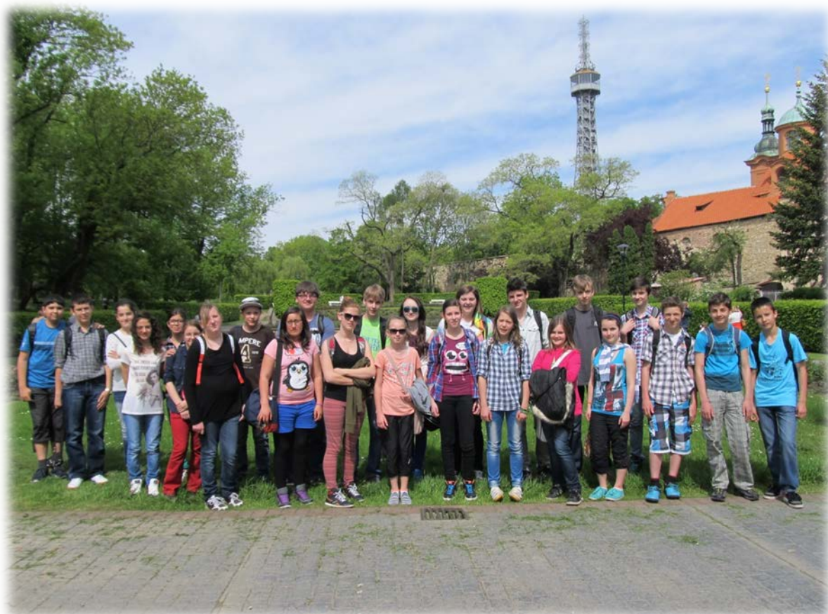
COMENIUS – návštěva Prahy (děti z Turecka, Německa, Slovenska a Česka)