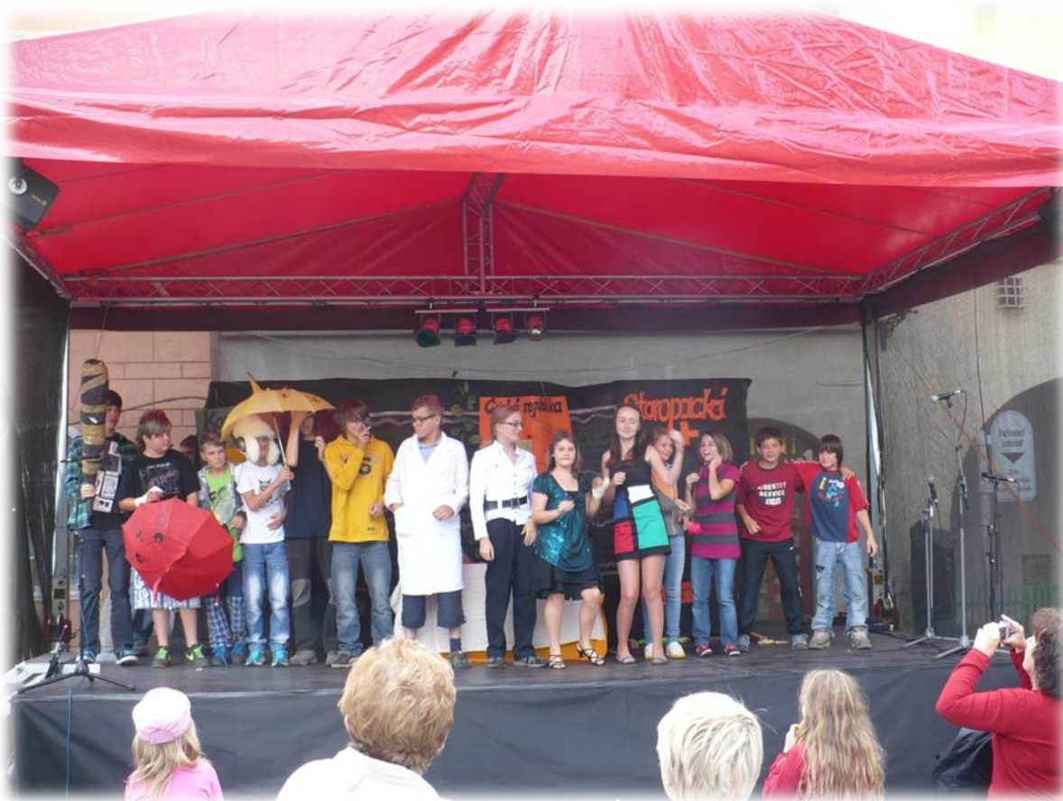
Dramatický kroužek při vystoupení v Jičíně – „Jičín město pohádek“